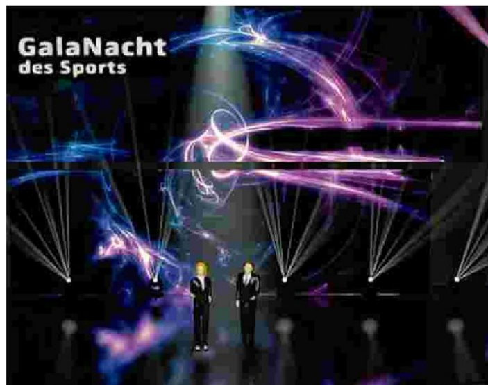
Modernste LED-Technologien für die Bühnenszenierung